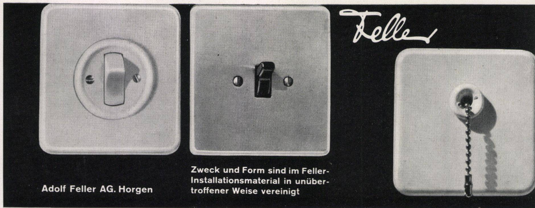
Adolf Feller AG. Horgen

Zweck und Form sind im Feller-Installationsmaterial in unübertroffener Weise vereinigt