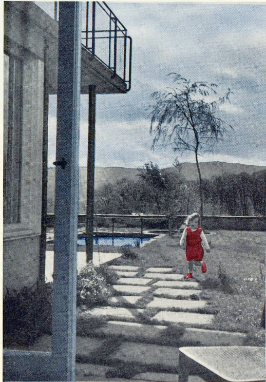
Die Türe der Halle zum Garten öffnet schon jedem den Blick in die Blumen, auf Bäume, Kinderspielplatz...