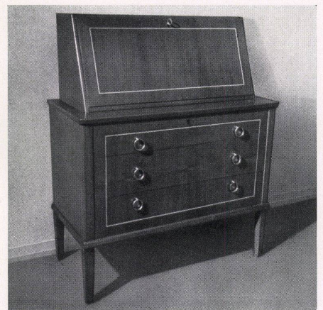
Möwa-Modelle (Möbelfabrik Wald AG., Wald-Zürich)