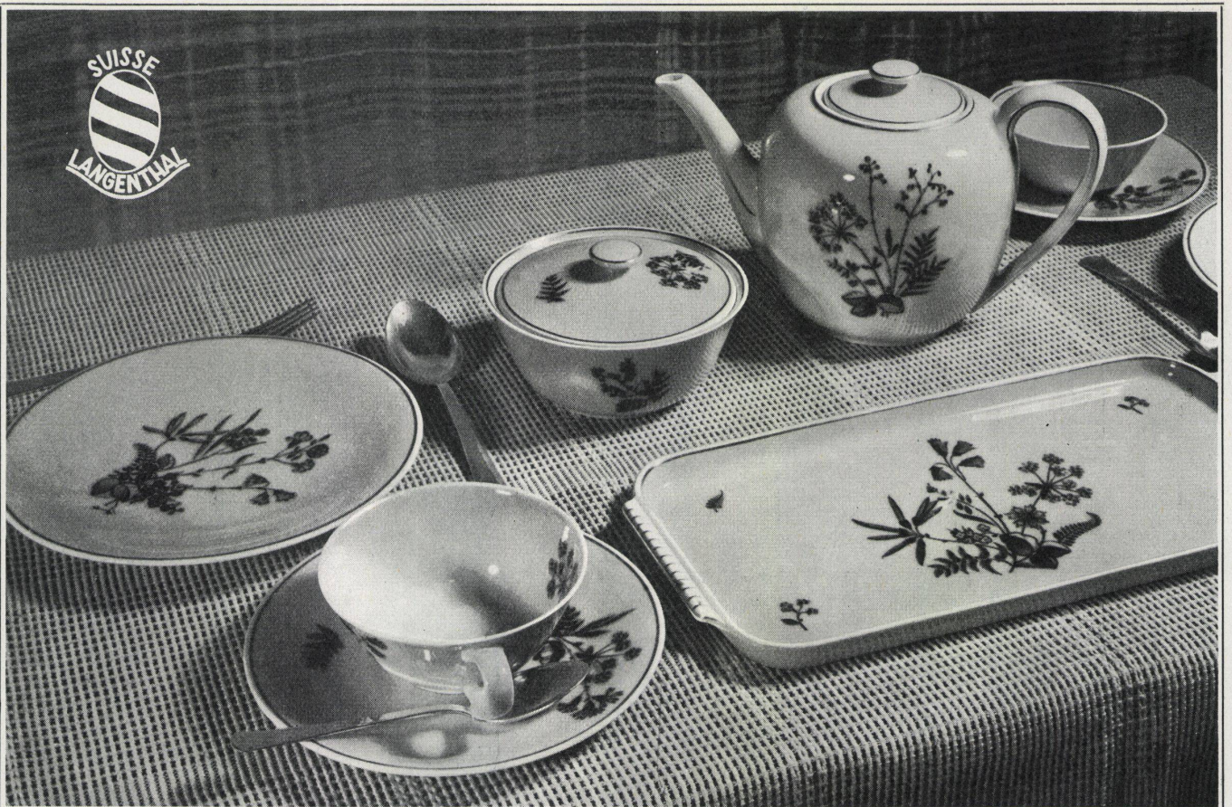
Langenthaler Elfenbeinporzellan mit blauem Kobaltdekor nach der Scharffeuertechnik