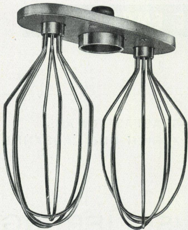
Auswechselbare Schwingbesen verwandeln den Original-Turmix in eine kleine Konditorei-Maschine.

Wenn man Amerikabesucher, die in die Schweiz zurückkehren, nach ihren Eindrücken über die Wohnverhältnisse Amerikas befragt, erwähnen sie stets auch die Küche der amerikanischen Hausfrau als kleines Wunder der raffinierten Einfachheit. Tatsächlich, die Amerikanerin verbringt viel weniger Zeit am Ort ihrer eigentlichen Haupttätigkeit. Der genormte Küchenschrank, der elektrische Herd mit Beleuchtung, die elektrische Geschirrwaschmaschine mit Spülbecken, der Kühlschrank und die in ihren Leistungen einzigartigen Küchenmaschinen, erlauben es ihr, mit einem Viertel an Arbeitsaufwand die gleichen und noch besseren Resultate zu erzielen als die schweizerische Hausfrau mit ihren noch so vielen Küchengeräten aller Art.