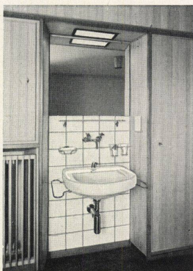
Sanitäre Anlagen / Techn. Büro