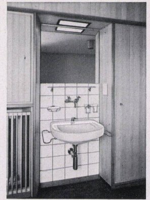
Sanitäre Anlagen Techn. Büro