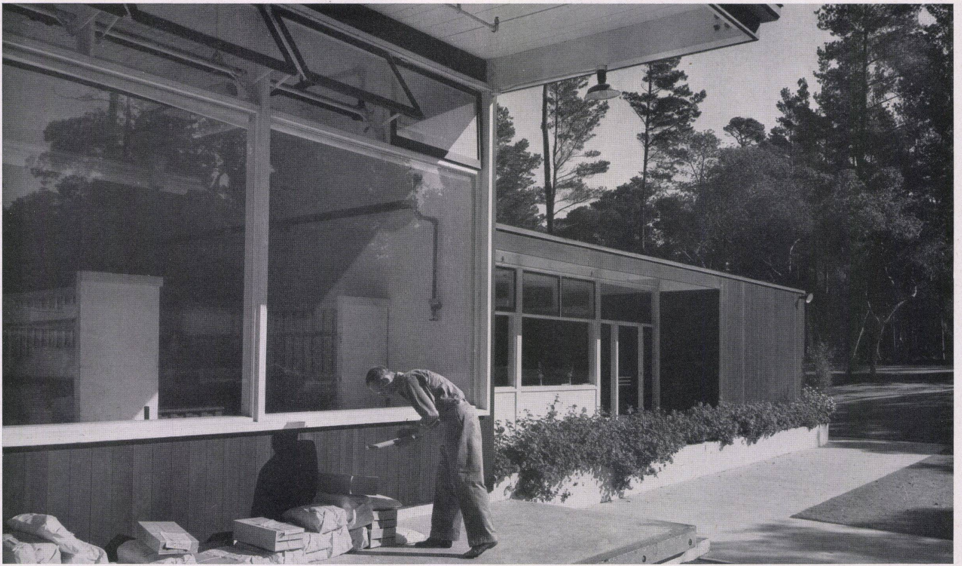
Verladerampe und Ruheterrasse / Rampe de chargement et terrasse de repos / Loading ramp and rest terrace.