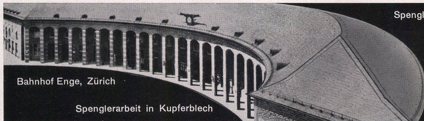
Bahnhof Enge, Zürich

stätte zum Norm-Fenster. Groß- und Detailaufnahmen vermitteln die Vielfalt der einzelnen Arbeitsphasen, aber auch einen vorbildlich organisierten Herstellungsablauf. Zu den eindrucklichsten Bildfolgen gehören hierbei Aufnahmen von einzigartigen Spezialmaschinen, welche zu den neuesten Errungenschaften der Technik zu zählen sind. Der Film wächst förmlich aus den Problemen der fortschreitenden Normierung von Bauteilen heraus, mit welchen er sich eingehend auseinandersetzt. Die filmische Handlung wirkt den ganzen Streifen hin-