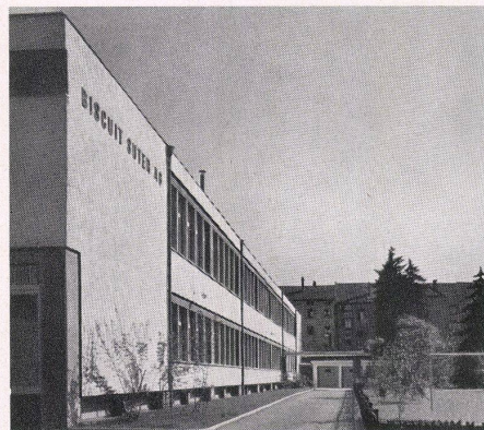
Blick von der Straße gegen den Eingang. Vue de la rue sur l'entrée. Street view towards the entrance.