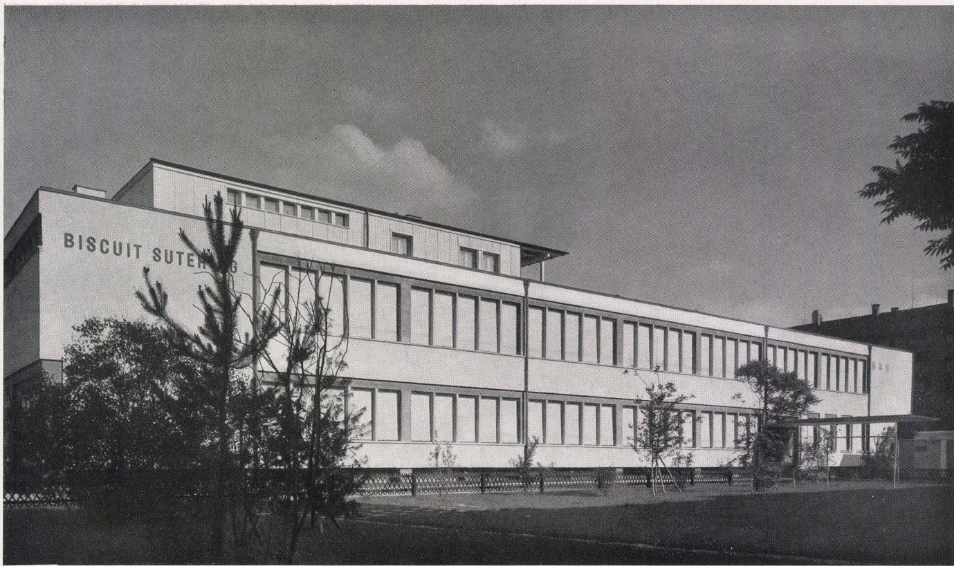
Gesamtansicht. Vue générale. Overall view.