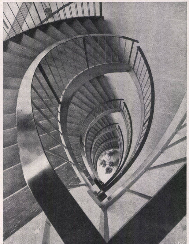
Treppe von oben