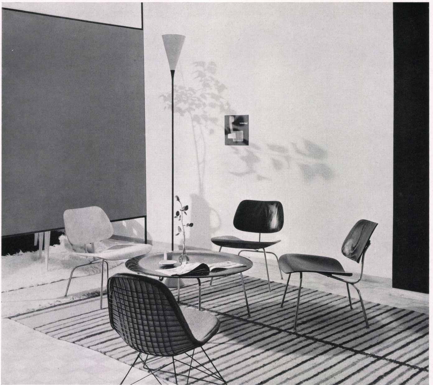
Sitzecke mit Teetisch und Stühlen von Charles Eames, Venice/Calif.

Coin de séjour avec petite table et sièges de Charles Eames, Venice/Calif.