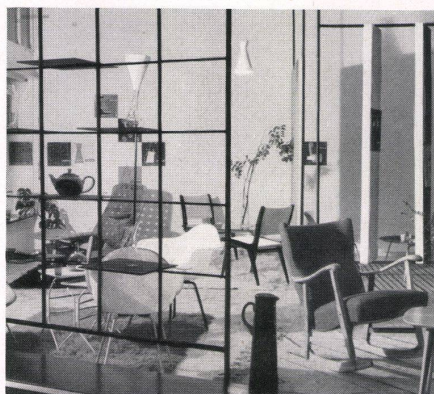
Blick vom Durchgang in den Verkaufsraum. La salle de vente vue du côté du passage. The sales room seen from the passage.

Eine weitere Aufgabe von »Intérieur« besteht in der Einrichtung von Wohnungen, Cafés, Restaurants usw.