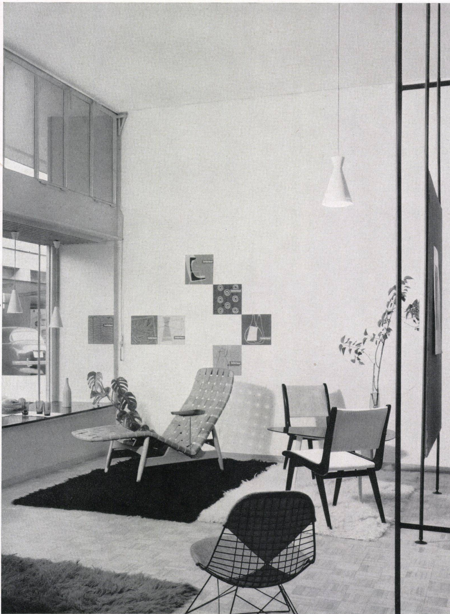
Eingangspartie mit dem Schaufenster links. Schwedische, deutsche und amerikanische Sitzmöbel. Côté entrée avec la vitrine à gauche. Sièges suédois, allemands et américains. Entrance section with the show window on the left. Swedish, German and American chairs.