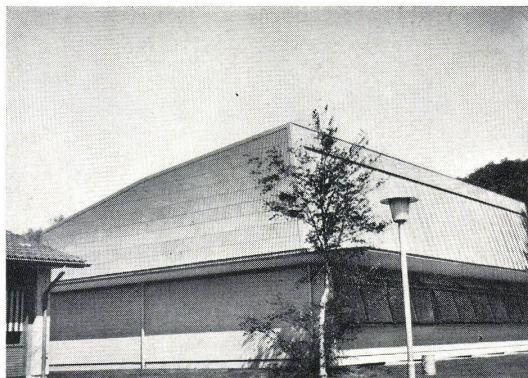
Turnhalle Steigerhubel Bern Dach- und Wandverkleidung in FURAL