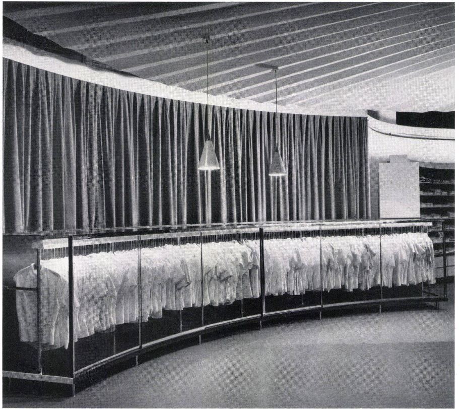
Verkaufskorpus für Damenblusen. Beleuchtungskännel mit Fluoreszenzröhren, Baldachin aus Hartstuck, Boden graugrüner Waron-Spannteppich.

Stühle: Gestell Stahlrohr verchromt, Sitz mit weißem Kunstleder bezogen. Sofas in Stoffabteilung: leuchtendgelbe Wollstoffbezüge. Vorhänge: Baumwollchintz, Druckmuster schwarz mit weißen Sternen. Beleuchtungspendel: mattweiß gespritzt. Kleiderschränke durch Spiegelglasplatten abgedeckt. Rampen mit Fluoreszenzbeleuchtung in Blumenkorpus und Kleiderschränken im Erdgeschoß.