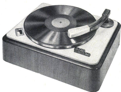
Audiomatic CBA 83 GE Pr mit eingebautem Vorverstärker und regulierbarem Pick-up

The loads of the three supporting walls of the transverse wall construction which has been employed rest on the strongly built original foundations.