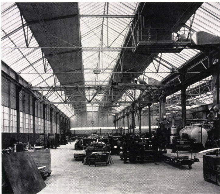
Fabrikationshalle, Krangerüst in Leichtmetall