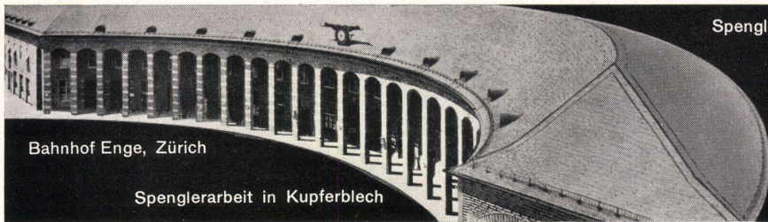
Bahnhof Enge, Zürich