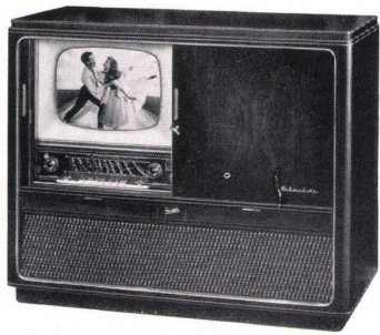
Modell MAHARADSCHA Fr. 2875.- Besonderheiten und Verkaufsargumente: 4-R-Raum- klang-Fernseh-Luxus-Musiktruhe mit 43 cm Bildröhre. 23+1 Röhren plus 5+1 Germaniumdioden und zwei Selengleichrichter. Ein Modell, das auch den höchsten Ansprüchen gerecht wird!