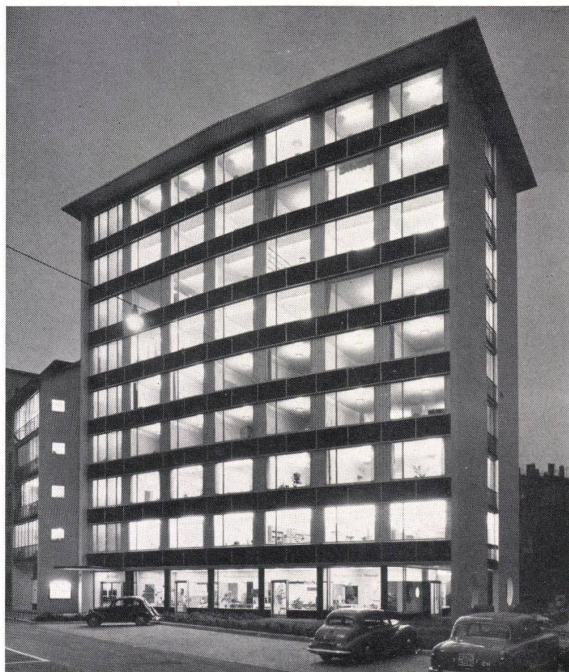
Die Fassadenverkleidung in Carrara-Glas sowie die Lieferung und der Einsatz von Polyglas für die Fenster wurden ausgeführt durch:

«Häßlichkeit verkauft sich schlecht» no. – Das Bemühen um die «gute Form» führte schon vor dem ersten Weltkrieg in den Vereinigten Staaten zur Gründung