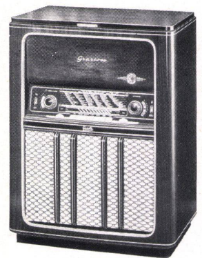
Modell GRAZIOSO Fr. 845.- Besonderheiten und Verkaufs- argumente: 8/10 Kreise; 7 Röh- ren; drehbare Ferritantenne mit optischer Anzeige. Plattenspieler oder 10-Platten- wechsler mit 3 Geschwindig- keiten.

— der weltbekannte Name bürgt für Qualität; darum wählen Sie GRAETZ!