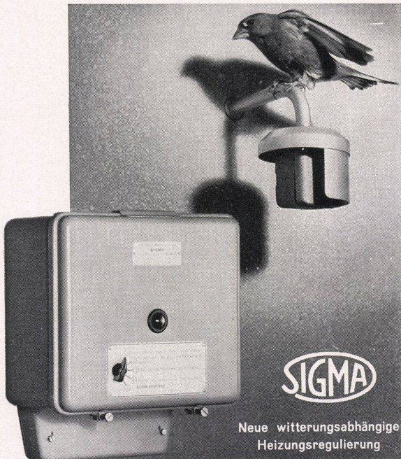
Neue witterungsabhängige Heizungsregulierung

Die witterungsabhängige automatische Zentralheizungs-Regulierung