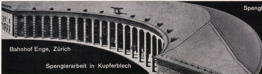
Bahnhof Enge, Zürich

die unbrennbare Platte für Akustik, Ventilation und Strahlungsheizung