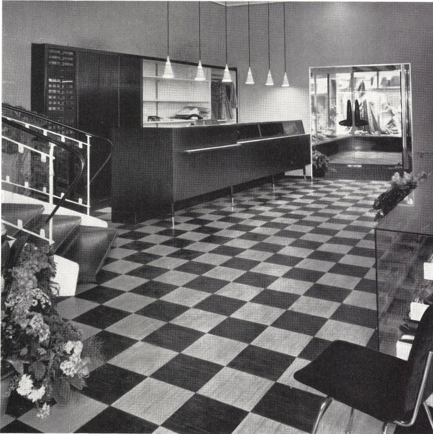
Modehaus „Spira“, Basel