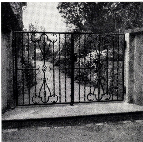
Nach der Vollbadverzinkung noch patiniert

Genossenschaft Hammer Eisenbau Zürich 3 Telephon 331818