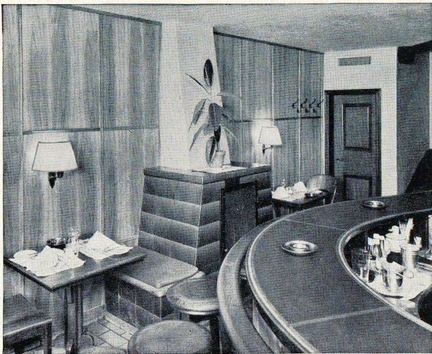
Die bekannte Schiffplänkebar in Zürich