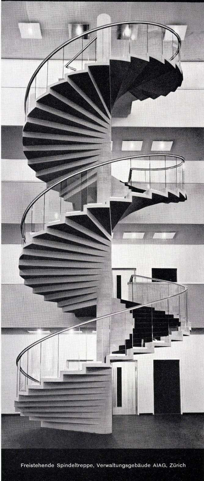
Freistehende Spindeltreppe, Verwaltungsgebäude AIAG, Zürich

Ausführung sämtlicher Kunststeinarbeiten