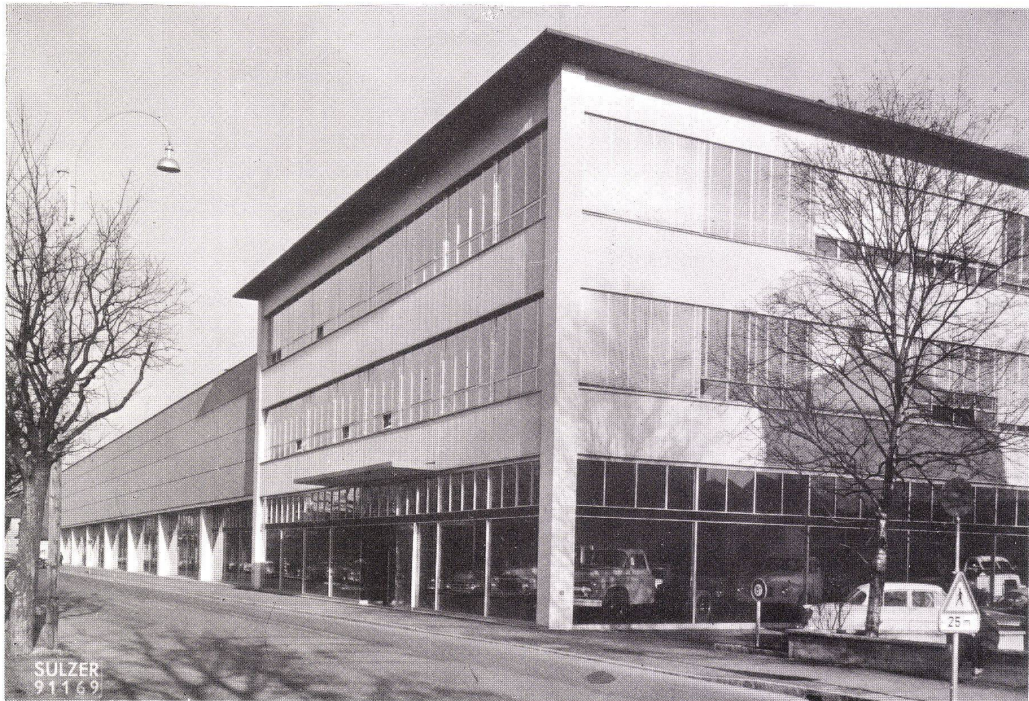
Montagewerk. Wärme- und lufttechnische Einrichtungen

Die Wärmewirtschaft stellt vielfältige Aufgaben. Am anspruchsvollsten zeigt sie sich dort, wo Probleme der Wärmezeugung, Wärmeverteilung, Beheizung, Lüftung und Luftkonditionierung gemeinsam zu lösen sind. Die Zusammenarbeit mit einer einzigen Firma bringt dem Bauherrn und Architekten ganz bedeutende Entlastung. Die Qualität unseres Mitarbeiterstabes und die unvergleichliche