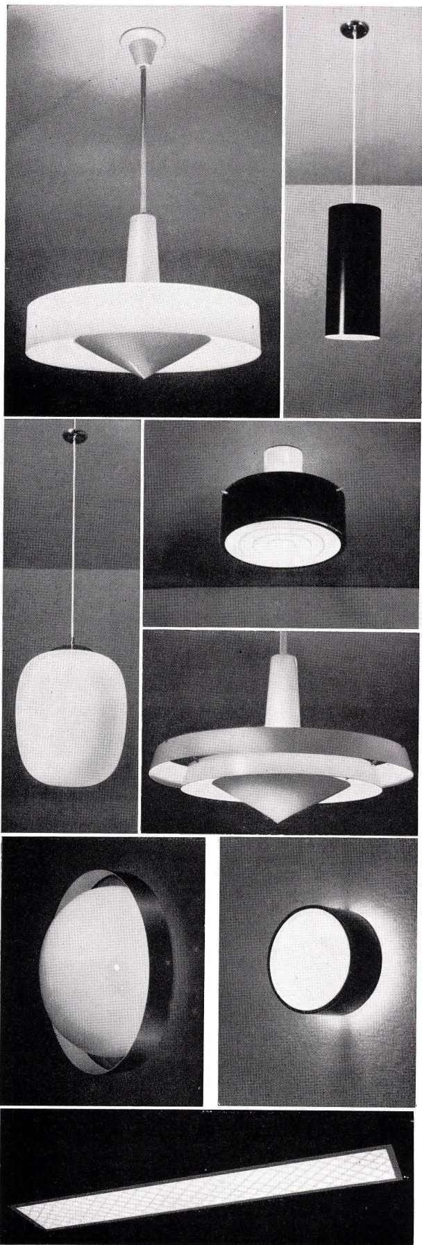
LICHT+FORM - Schulhauleuchten aus Aluminium, Plexiglas und Glas für alle Schulräume und Turnhallen. LICHT+FORM - Leuchten sind bekannt in allen Fachkreisen als zweckmäßig, formschön und preiswert.