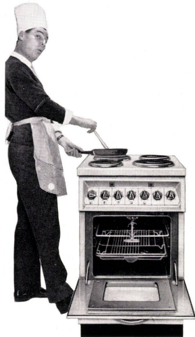
Dr. M. Heuberger Reklameberater / Gestaltung H. Buholzer

mit dem PROMETHEUS-BEL-DOOR-Herd hat sich schon mancher Mann als Koch entdeckt. Hell begeistert sind alle vom grossen Backofen mit Innenbeleuchtung und den zuverlässigen Leuchtschaltern. Weitere BEL-DOOR-Rosinen: Beheizbare Geräteschublade, aushängbare Backofentüre mit Schauglas, schräges Schalterpult, Thermostat, Infrarotgrill sowie Grillspieß mit Motor.