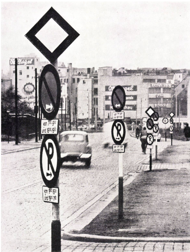
Der unlesbare Schilderwald an einer Hamburger Verkehrsstraße.

falschen Regulativen, falscher Ethik, falschen Maßstäben, falschen Planungsmethoden und falschen Zuständigkeiten gekommen ist. Unsere Bemühungen nützen daher bisher wenig oder gar nichts, sie bewirken oft – wie jede angewandte Wissenschaft mit falschen Voraussetzungen – das Gegenteil. Sie vermehren das Unheil.