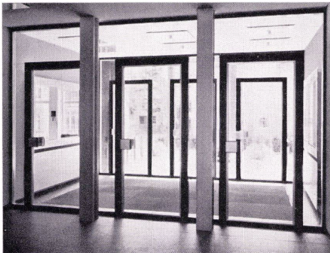
Schauen fenster-Anlagen Türen — Portale

Bürogebäude der Radiatorenfabrik Gebr. Zehnder AG, Gränichen H. Hauri, dipl. Arch. ETH, Reinach AG