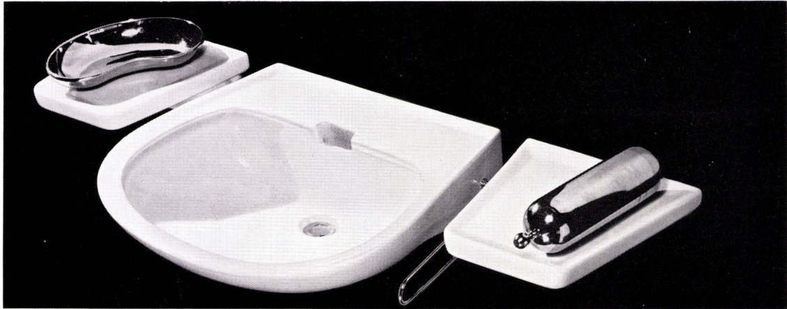
Waschtisch Carina H Hôpital No. 7100, dazu passend Abstell- tablar No. 8740. Das neue Tablar ist links, rechts oder zwischen zwei Waschtischen montierbar. (Internationaler Musterschutz angemeldet.) Sabez Sanitär-Bedarf AG., Sanitäre Apparate und Armaturen Zürich 8/32, Kreuzstrasse 54, Telefon 051/24 67 33

Unimatic-Favorite-10, der ideale Waschautomat für Gewerbe- betriebe. Seine bewährten Vor- teile: Grosses Fassungsvermö- gen von 10 kg Trockenwäsche; modernste Tastenbedienung; doppelseitig gelagerte Trommel; vollautomatische Programme mit zweimaligem Vorwaschen für stark verschmutzte Wäsche;