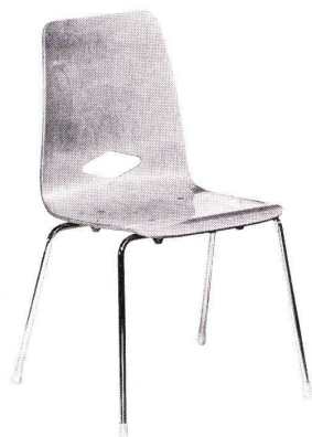
Modell 6006 S

Satz und Druck Huber & Co. AG, Frauenfeld