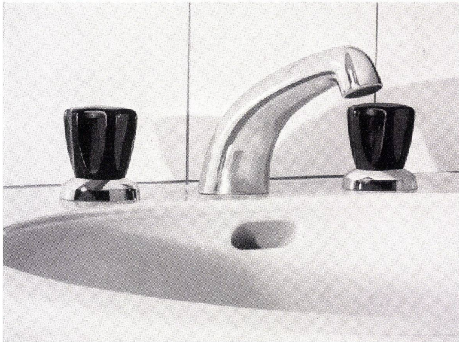
Waschtischbatterie Nr. 3071