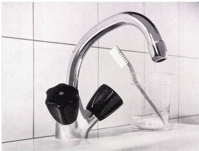
Einloch-Waschtischbatterie Nr. 3073