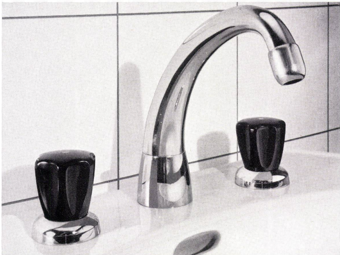
Waschtischbatterie Nr. 3076

Eingedenk der Tatsache, daß die formschöne Armatur ein wesentliches Element moderner Wohnkultur darstellt, hat KWC eine Reihe neuer Waschtischarmaturen entwickelt, die dank ihrer zeitlosen Eleganz und ihrem qualitativen Niveau Spitzenprodukte repräsentieren. Modernes Formempfinden und traditionelles Streben nach überragender Qualität waren die Leitmotive bei der Entwicklung dieser neuen Armaturentypen.