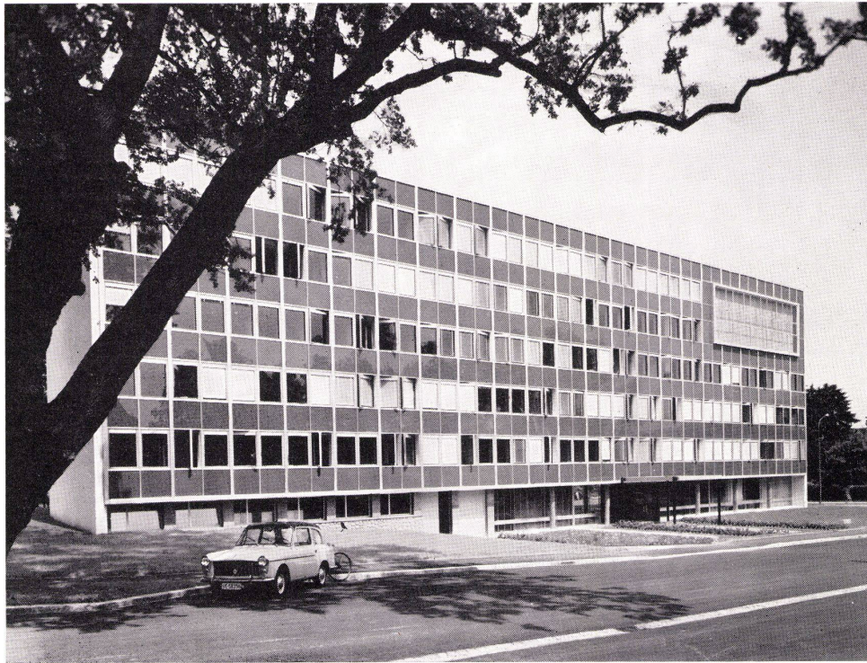
Organisation Météorologique Mondiale