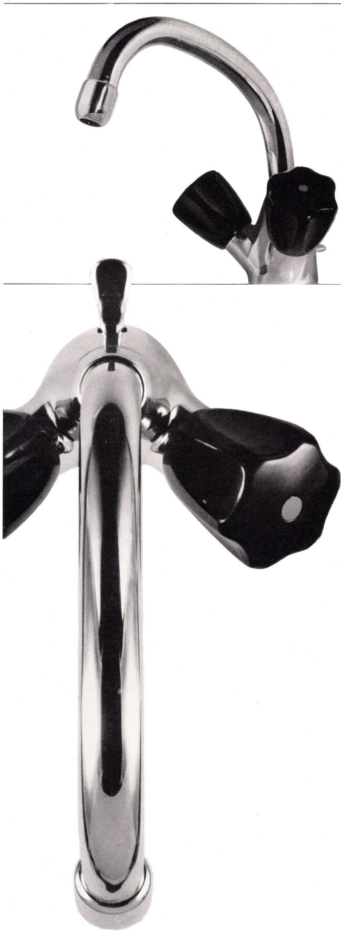
Einloch-Waschtischbatterie Nr. 3072 mit schwenkbarem Auslauf und Ablaufventil