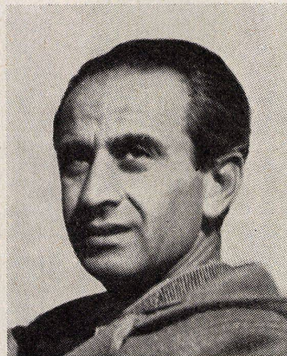
Aris Konstantinidis ▲

Palast des Kronprinzen von Japan in Tokio, Entworfen 1958, gebaut 1960