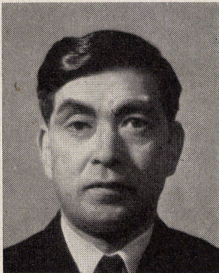
Yoshiro Taniguchi ▲