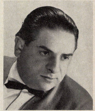
◀ Charles Eames

Auszeichnung für einen Möbelentwurf »Die gute Form 1958«