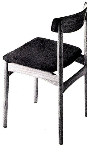
Mod. 760 P