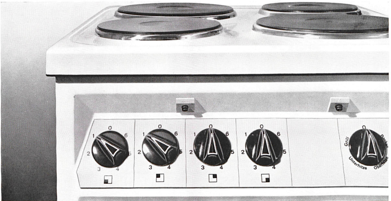
Dr. Heuberger + Frey, Grafik Edi Hauri

PROMETHEUS AG Liestal/BL Telephon 061-84 44 71