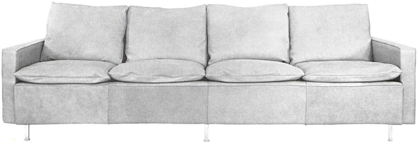
ledersofa modell 341 aus unserer möbelkollektion

Brunner & Cie. Lenzburg Gebrüder Dillier, Sarnen Ganz & Co. Embrach AG, Embrach Ofenfabrik Kohler AG, Mett bei Biel Gebrüder Kuntner, Aarau Gebrüder Mantel AG, Elgg