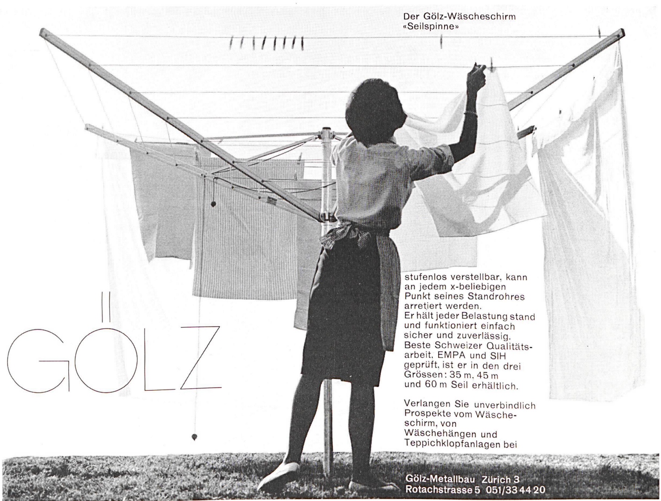
Der Gölz-Wäscheschirm «Seilspinne»