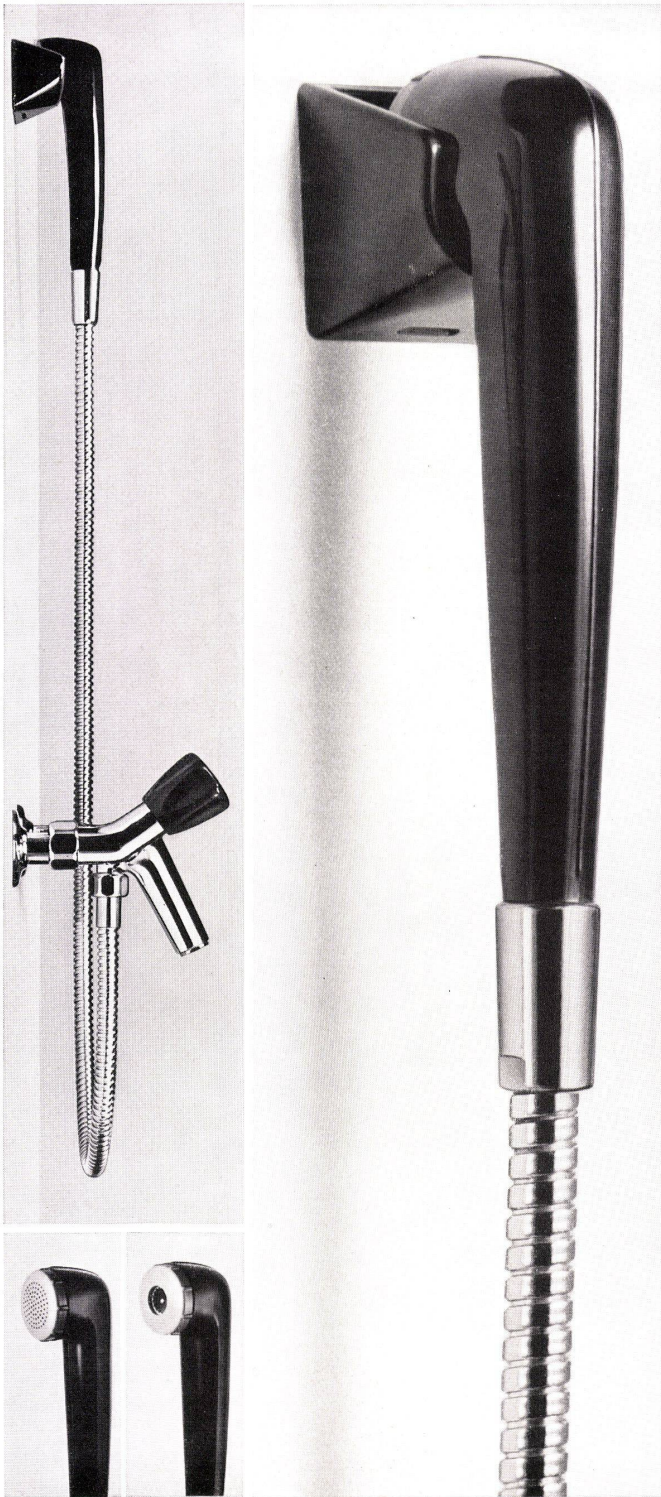
Badebatterie Nr. 1724 mit Handbrause Nr. 7702

Schlichtheit der Form, durchdachte Konstruktion und sorgfältige Ausführung in erstklassigen Materialien sind die Merkmale der KWC-Batterie Nr. 1724. Das gleiche gilt auch für die Handbrause Nr. 7702. Diese wird mit Siebbräuse als Standardausführung geliefert, kann aber auf Wunsch gegen die Presto-Sportbräuse ausgetauscht werden.