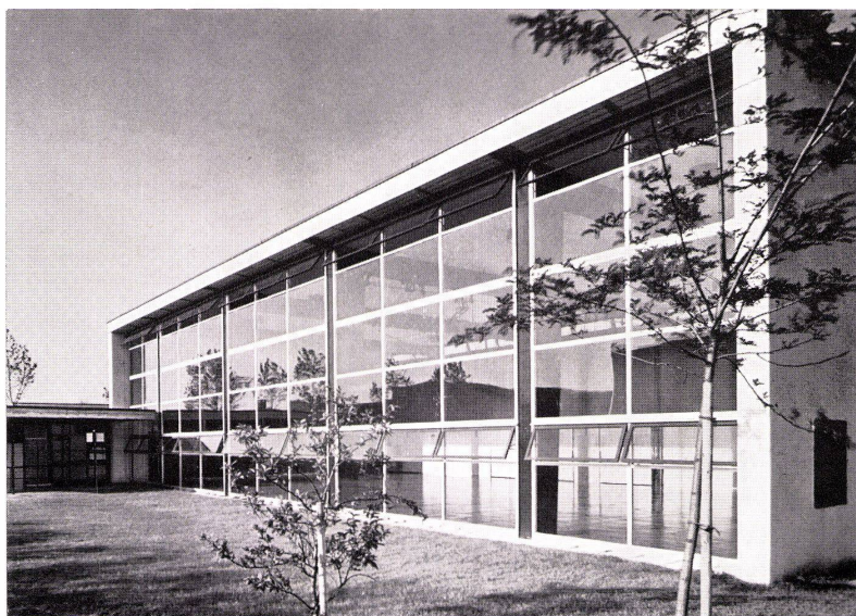
Turnhalle Wasgenring, Basel