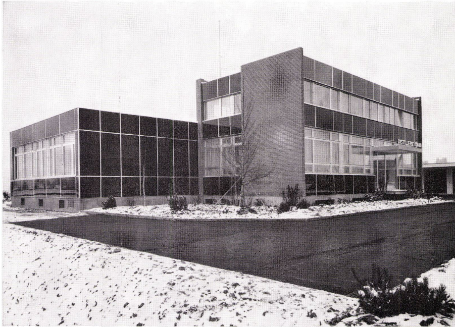
Distillerie König, Steinhausen ZG