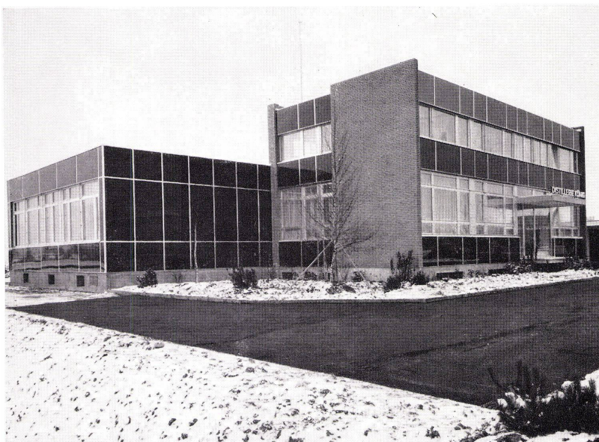
Distillerie König, Steinhausen ZG

Heinrich Guggenbühl + Co. Die Spezialisten sinnvoller Büro-Raumplanung 8004 Zürich, Stauffacherstr. 16 Telefon (051) 27 55 92