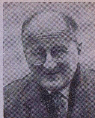
Nikolaus B. L. Pevsner

Geboren im September 1909 in Lancashire. Studium: Victoria-Universität, Manchester (School of Architecture). Arbeit in London, Leeds, Southampton und West Riding of Yorkshire. Chefarchitekt bei The London County Council und Greater London Council seit 1956. Mitglied: Royal Institute of British Architects. Advisory Committee on Building Research, Ministry of Technology 1959-67, Standing Conference on London Regional Planning 1963-65. Auszeichnungen: RIBA-Bronzemedaille, Civic Trust Awards, Ministry of Housing Award for Good Design in Housing, Architectural Design Grand Project Award.