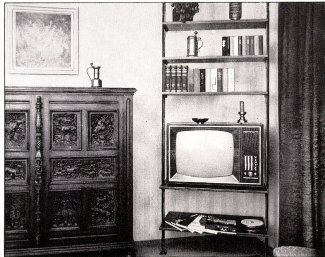
RUDOLF BOHNACKER · METALLWARENFABRIK Verkauf durch den Fachhandel

heute in der Schweiz vorhandenen Möglichkeiten des industrialisierten Bauens orientieren.