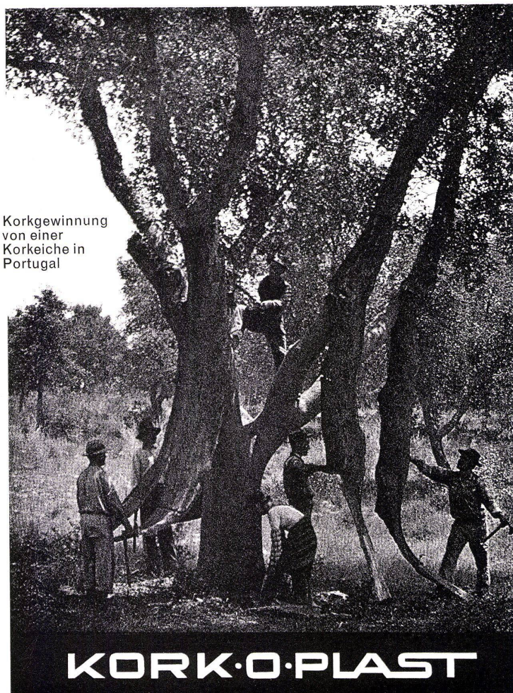
Korkgewinnung von einer Korkeiche in Portugal

9009 ST. GALLEN Lukasstrasse 30 071 / 24 68 65 8040 ZÜRICH Badenerstrasse 329 051 / 54 86 86 1700 FRIBOURG 3, avenue Beauregard 037 / 2 48 06 7002 CHUR Gäuggelistrasse 4 081 / 22 06 45 6000 LUZERN Unt. Dattenbergstr. 8 [041 / 41 10 86