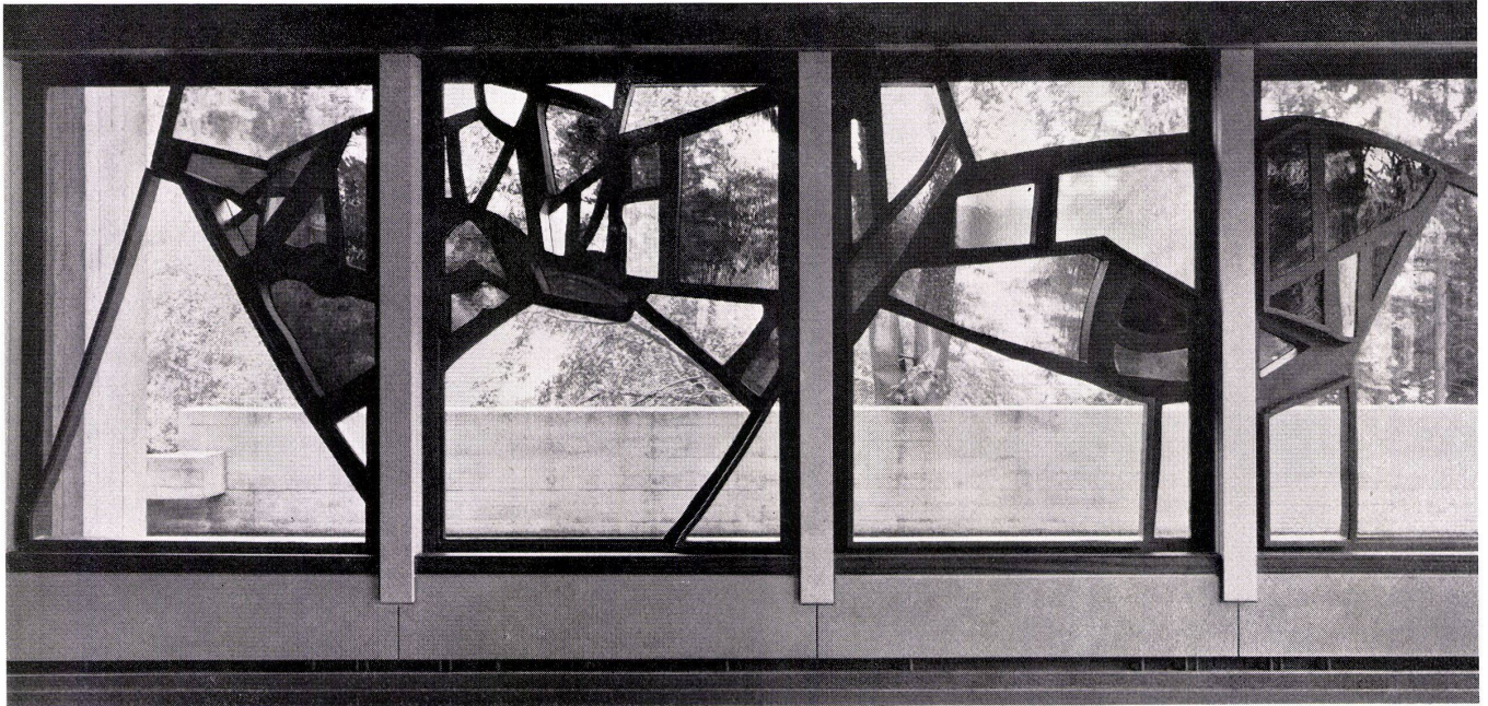
Metallfassaden und Metallfenster

Hochschule St.Gallen. Projektierung der Fassaden- und Fensterkonstruktionen. Fenster, Pfeiler, Brüstungsverkleidungen, Vordach und Eingangspartie in Eisen. Abbildung: Stahl-Glas-Komposition in der Aula von Coghuf.