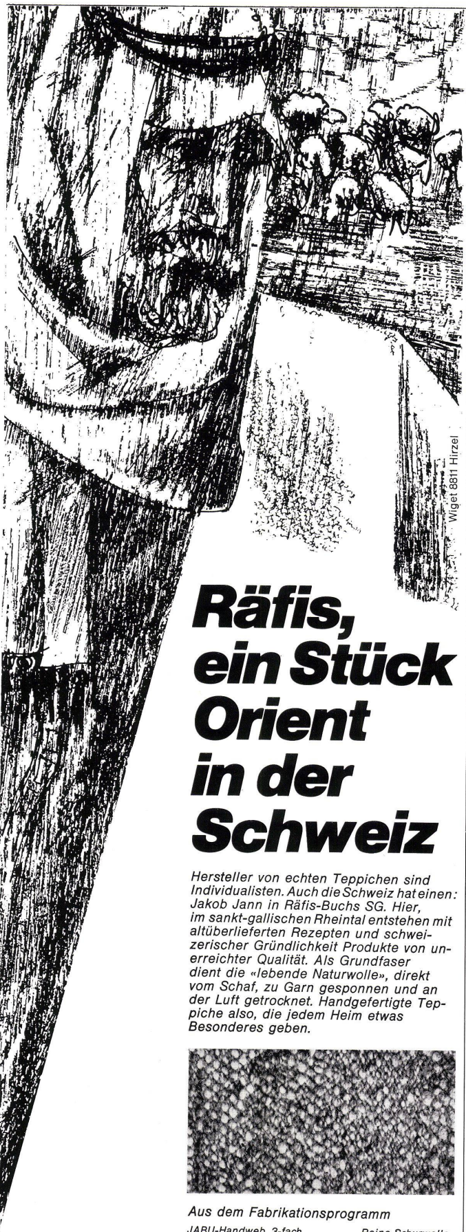
Wiget 8811 Hirzel