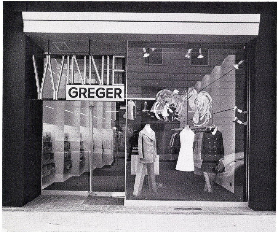
1 Straßenansicht mit Eingang und Schaufenster. Vue côté rue avec entrée et vitrine. Street view with entrance and display window