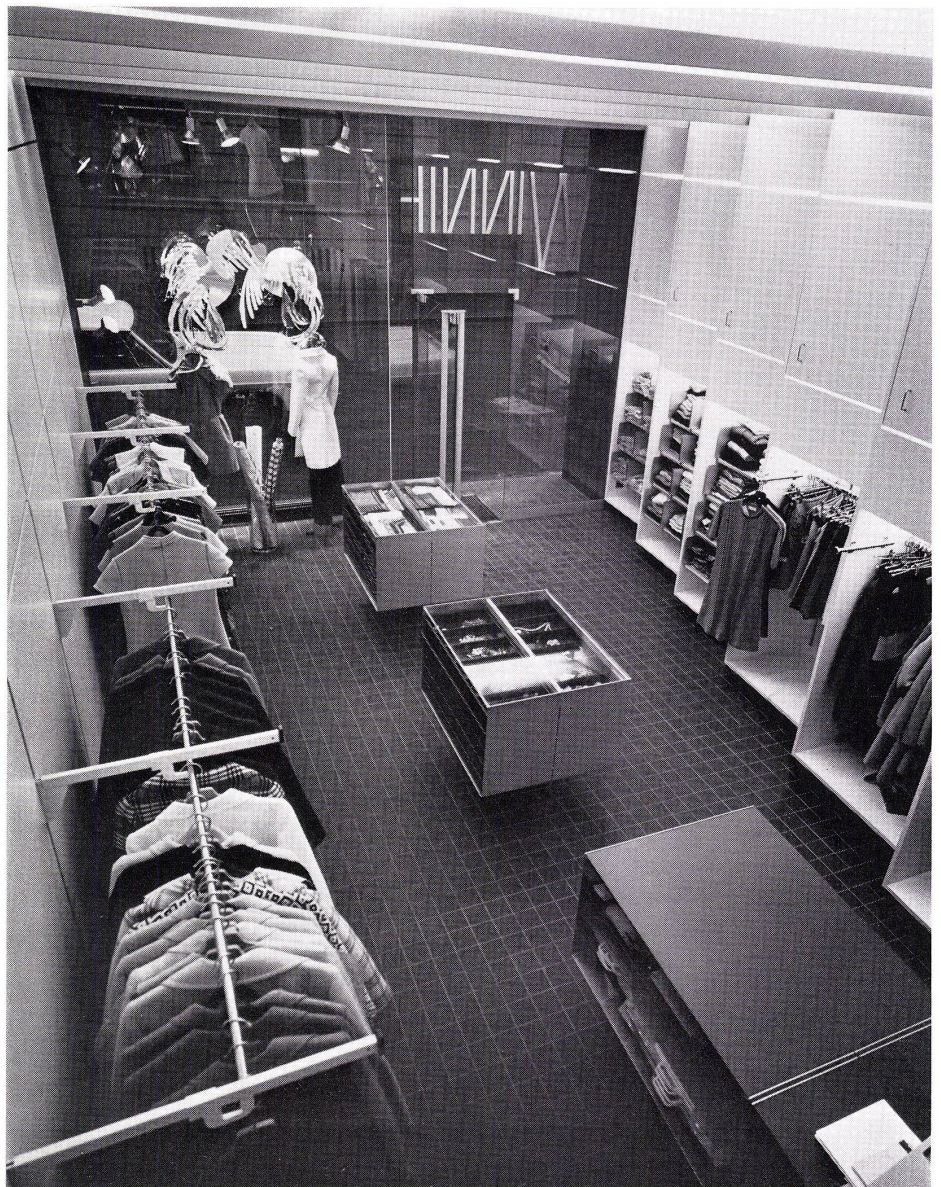
2 Ladeninneres vom Lager aus gesehen. L'intérieur de la boutique vu du dépôt de marchan- dises. Interior of shop from stock room.