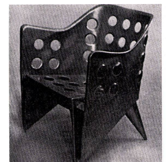
Stuhl aus einem Stück geformt, 1942.